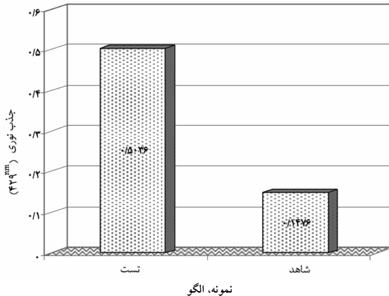
نمودار ۱ مقایسه میانگین جذب نوری آنژیواستاتین در سرطان پستان و گروه شاهد