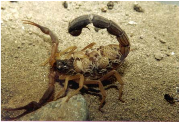
شکل ۱ عقرب ماده Buthotus jayakari به همراه نوزادان سن اول

بند آخر مزوزوما) و سپر سری (کاراپاس) اشاره کرد. اعضای باقیمانده بدن در این گونه به رنگ زرد روشن تا تیره می باشد. دم (متازوما) در این گونه غیر پشمالو بوده و تعداد دندانهای شانه در جنس نر ۳۶-۳۹ و در ماده ها ۳۲-۳۶ عدد است (شکل ۱).