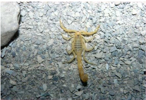
شکل ۲ عقرب ماده Buthacus leptochelys

می رسد. رنگ بدن در سطح پشتی زرد کم رنگ تا کدر اما اعضای آن روشن تر است. سپر سری (کاراپاس) بدون گرانول و بر حسب فرم محلی صاف یا با گرانولهای پراکنده، چشمهای جانبی کوچک است. تعداد دندانهای شانه در نرها ۳۰-۳۲ و در ماده ها ۲۵-۲۷ عدد می باشد (شکل ۲).