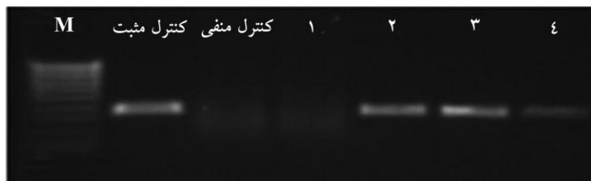
شکل ۱ تصویر نمونه‌های HPV تیپ ۶؛ نمونه‌های ۲، ۳ و ۴ دارای باند مثبت روی ژل در ناحیه ۴۳۵ جفت باز هستند محصول PCR مرتبط به نمونه کنترل مثبت و کنترل منفی در شکل مشخص شده است.