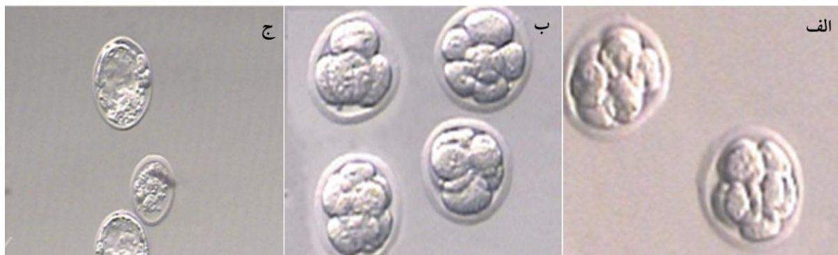
شکل ۱ جنین‌های ۸ سلولی غیر منجمد (الف)، جنین‌های ۸ سلولی بعد از انجماد و گرم کردن (ب) و جنین‌های بلاستوسیست بعد از انجماد مجدد (ج)، بزرگنمایی \times 200

*: تفاوت معنی دار با گروه کنترل وجود دارد ( P < 0/05 )