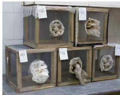
شکل ۱ سمت راست: قفس‌های نگهداری پشه‌های بالغ. سمت چپ: لیوانهای محتوی لارو