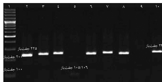
شکل ۲ ستون ۱) نشانگر وزنی ۱۰۰ جفت‌بازی، ستون‌های ۲، ۳، ۴، ۶، ۷، ۸) حضور باند ۲۲۵ جفت‌بازی و نشانگر ژنوتیپ ۲، ستون ۵) حضور باندهای ۱۰۵ و ۱۰۶ جفت‌بازی و نشانگر ژنوتیپ ۳، ستون ۹) کنترل منفی، ستون ۱۰) نمونه بدون هضم آنزیمی به‌عنوان کنترل مثبت

نبود. بنابراین طی این پژوهش، ژنوتیپ ۲ با تعداد ۱۱ مورد (۹۱/۶ درصد) و ژنوتیپ ۳ با ۱ مورد (۸/۳ درصد) مجموع ژنوتیپ‌ها را در نمونه‌های مورد آزمایش تشکیل داد. برای افزایش دقت کار، پس از تهیه و آماده‌سازی ژل آگارز ۳ درصد، از آب مقطر DEPC زده شده به‌عنوان کنترل منفی، از نمونه مثبت بدون هضم آنزیمی به‌عنوان کنترل مثبت و از نشانگر وزنی ۱۰۰ و ۵۰ جفت‌بازی داخل چاهک‌های ژل ریخته شد و پس از گذشت زمان لازم و رنگ‌آمیزی اتیدیوم بروماید نتایج بررسی شد. با مقایسه باندهای به‌دست آمده تعیین ژنوتیپ‌های GBV-C انجام شد (شکل ۲). در انتها برای تأیید نتایج کار، به‌طور تصادفی تعدادی از نمونه‌ها برای تعیین توالی استفاده شد که نتایج حاصل درستی و دقت روش به‌کاررفته را مشخص کرد. لازم به ذکر است آنزیم DraII از شرکت Fermentas (کانادا) و BanII از شرکت Vivantis (مالزی) خریداری شد.