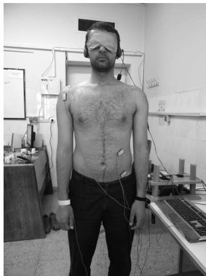
شکل ۱. نمایی از وضعیت ثبت اطلاعات

حداکثر شتاب این حرکت و انحراف معیار آن در هر فرد مشخص شود. این تکرار آزمون‌ها به تعداد حداقل ۲۰ مرتبه (که پیش از شروع ۷۵ ثبت اولیه انجام شد) به دو منظور محاسبه میانگین حداکثر شتاب و از بین بردن اثر یادگیری انجام شد. طی هر مرحله از انجام آزمایش، چنانچه در هر تکراری از وضعیت‌های آزمون، میزان حداکثر شتاب اندام کمتر از ۲ برابر انحراف معیار میانگین شتاب فرد بود، آن تکرار حذف می‌شد. برای جلوگیری از بروز خستگی، هر فرد حداقل پس از انجام ۲۰ تکرار استراحت کرده و در صورت لزوم زمان بیشتری برای استراحت به آن‌ها داده شد. با توجه به یکسان بودن میانگین تغییرات ده تکرار اول از ۷۵ تکرار هر فرد با ده تکرار آخر همان فرد، از عدم اثر پدیده‌های خستگی و یادگیری اطمینان حاصل شد.