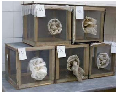
شکل ۱ سمت راست: قفس‌های نگهداری پشه‌های بالغ. سمت چپ: لیوانهای محتوی لارو