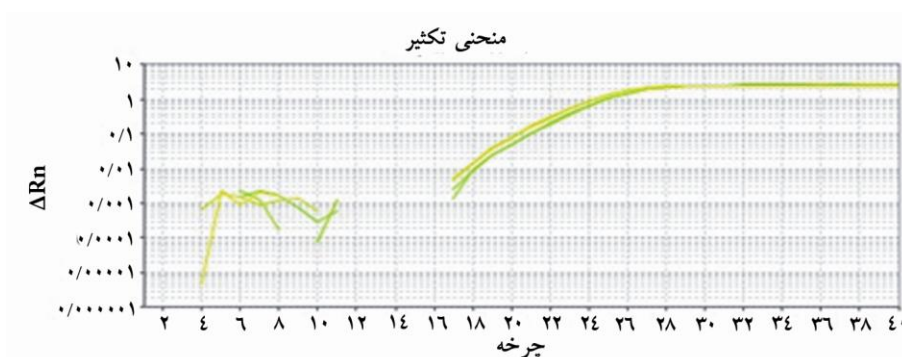
شکل ۲ تصویر بیان ژن کنترل درون زاد بتا اکتین